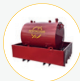
Estanque de petróleo