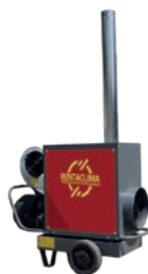
CI-025KW - CI-050KW