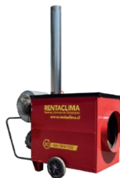
CI-100KW 150KW 200KW