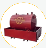
Estanque de petróleo