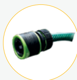
Conexión a manguera