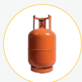
Cilindro de gas